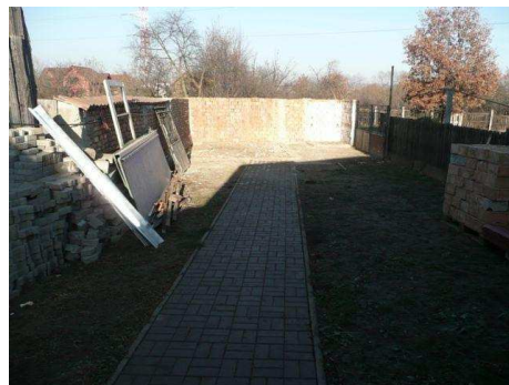
... extend the warehouse