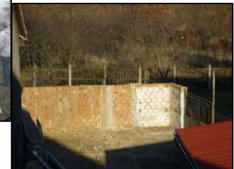
... is already done