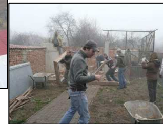
...breaking down piggery...