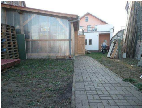
Here in this area we will...