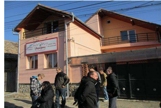
Papageno Association in Romania