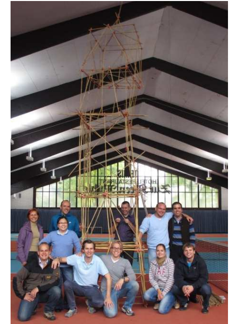
Our team: Coming together is a beginning; keeping together is progress; working together is success.

Thank you for your interest and your donations!