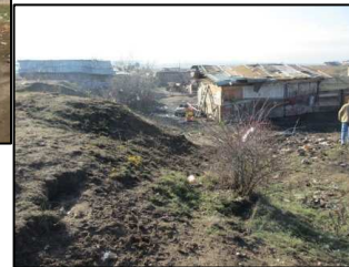
...Roma residential area