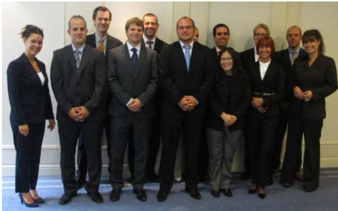
Fiege International Team 2012