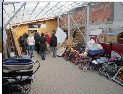
...needs to be extended